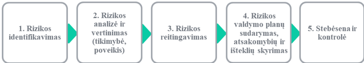
1 pav. Rizikos valdymo procesas

AB „Kelių priežiūra“ taiko rizikos valdymo procesą sudarytą iš 5 etapų. Kiekvieno etapo dalyviai, jų atsakomybės ir funkcijos aprašyti „Rizikos identifikavimo, vertinimo ir valdymo metodikoje“.